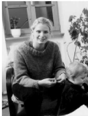
Alleinerziehende brauchen besondere Unterstützung.

Die Fragestellungen in der Lebensform 'Alleinerziehend' sind oftmals sehr vielfältig und komplex. Daher braucht es unterschiedlichste Beratungs-, Unterstützungs- und Vernetzungsangebote. Grundsätze dafür sind: Selbsthilfe