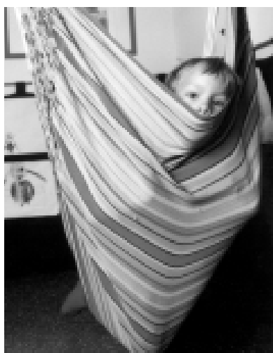
Angst essen Seele auf – Missbrauchten Kindern fällt es schwer, über ihre Erlebnisse zu sprechen.

Autor: Helmut Neuberger Funktion: Referent für Familienarbeit Kontakt: neuberger.helmut@diakonie-bayern.de