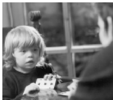
Bisher fielen die Kosten der Frühförderung in jedem Landkreis unterschiedlich aus. Ein neuer Rahmenvertrag in Bayern soll dies ändern.

derung erarbeitet. In einem weiteren Dutzend Sitzungen verhandelte man über die Finanzierung, fand Kompromisse und verwarf sie wieder, machte neue Anläufe und entwickelte Alternativen, führte Krisen- und Vermittlungsgespräche. Schließlich lag er da: „Der Rahmenvertrag zur Früherkennung und Frühförderung behinderter und von Behinderung bedrohter Kinder in Interdisziplinären Frühförderstellen in Bayern“, abzuschließen zwischen den kommunalen Spitzenverbänden, der Arbeitsgemeinschaft der Krankenkassenverbände in Bayern, den Trägerverbänden der Interdisziplinären Frühförderung und der Kassenärztlichen Vereinigung Bayerns.