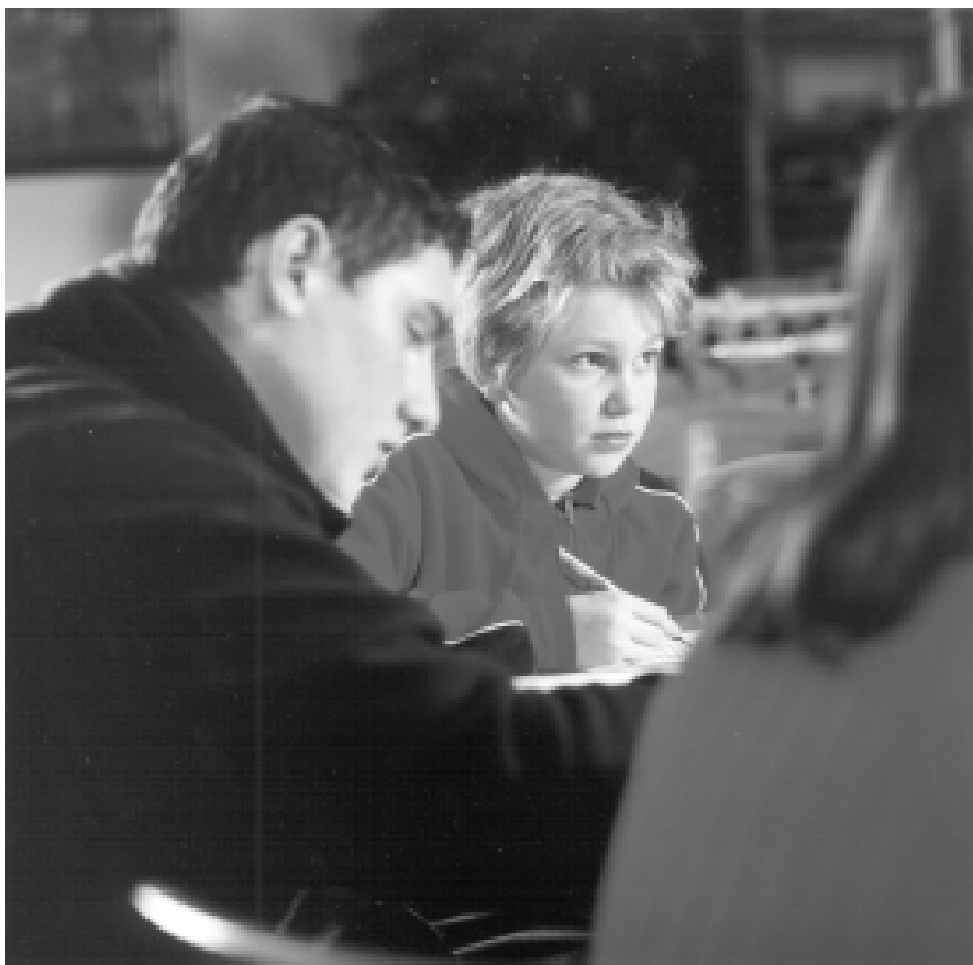
Zugewanderte sollen gesetzlich verpflichtet werden, Deutschkenntnisse zu erwerben.

Maße zu verpflichten, Deutschkenntnisse zu erwerben und um Deutschkenntnisse als Einreisebedingung einzuführen. Sie tritt dafür ein, dass das Aufenthaltsgesetz künftig eine allgemeine „Integrationspflicht“ enthält. Die Frage ist jedoch, ob sich die Integration auf diesem Wege erzwingen lässt.