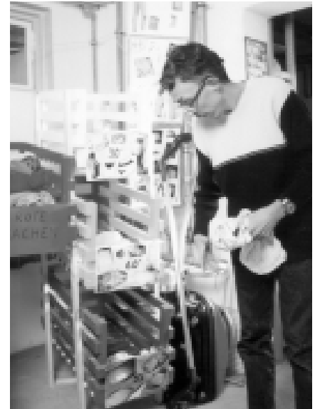
Herr K. ist trotz seiner geistigen Behinderung in der Lage, seine Wäsche zu sortieren und zu waschen.

Die Diakonie setzt sich deshalb seit fast zehn Jahren für eine diesbezügliche Gesetzesänderung ein, leider jedoch ohne Erfolg. Das Problem ist bekannt, aber eine Entscheidung zugunsten der Menschen mit Behinderung und der bayerischen Steuerzahler wird immer wieder verschoben. Auch der neueste Entwurf des AG SGB will bei der Hilfe für Menschen mit Behinderung alles beim alten lassen, obwohl in