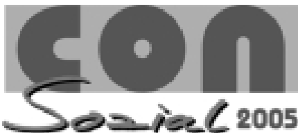
7. Fachmesse und Congress für den Sozialmarkt in Deutschland

Die bayerische Diakonie präsentiert sich auf der ConSozial 2005 mit einem Gemeinschaftsstand