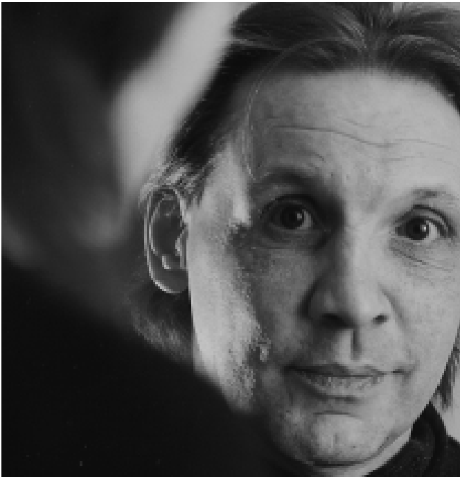
Die Diakonie setzt sich dafür ein, dass Straffällige nicht sozial isoliert und gesellschaftlich an den Rand gedrängt werden.

Diakonische Straffälligenhilfe stellt eine der Grundformen Diakonischen Handelns dar. Sie nimmt sich Menschen an, die gesellschaftlich an den Rand gedrängt und stigmatisiert werden, denen zeitlebens mit großen Vorurteilen begegnet wird.