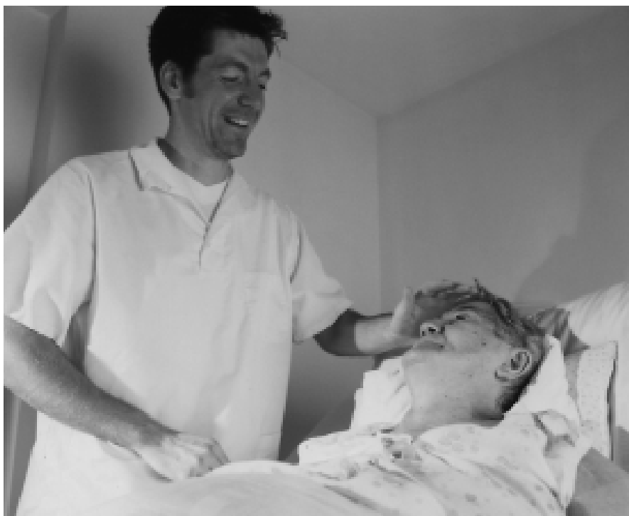
Gute Pflege ist mehr als nur „satt und sauber“ – Zeit für ein persönliches Gespräch ist wichtig.

Die Ausbildungszeit in der Altenpflege wurde von zwei auf drei Jahre verlängert. Dadurch fällt ein ganzer Jahrgang aus. Diese Lücken verschärfen die Lage und lassen sich nur durch eine sofortige bessere Finanzierung der Ausbildungsplätze mittelfristig wieder auffangen.