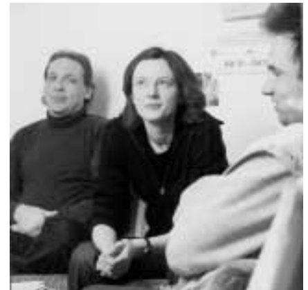
Da ist guter Rat teuer: Wohin können sich Betroffene noch wenden, wenn in Zukunft diakonische Beratungsstellen aufgrund der Kürzungen geschlossen werden müssen?

Auf der Ebene der Bezirke setzt sich nach Auffassung Markerts damit jene Politik fort, die mit der Regierungserklärung von Edmund Stoiber im November 2003 begann und auf Landesebene zu einem Nachtragshaushalt führte, in dem die Mittel des Sozialministeriums um 161 Millionen Euro gekürzt wurden. Bereits im Februar hatten die angekündigten Kürzungen zu Entlassungen und der Streichung einzelner Angebote der Diakonie in ganz Bayern geführt.