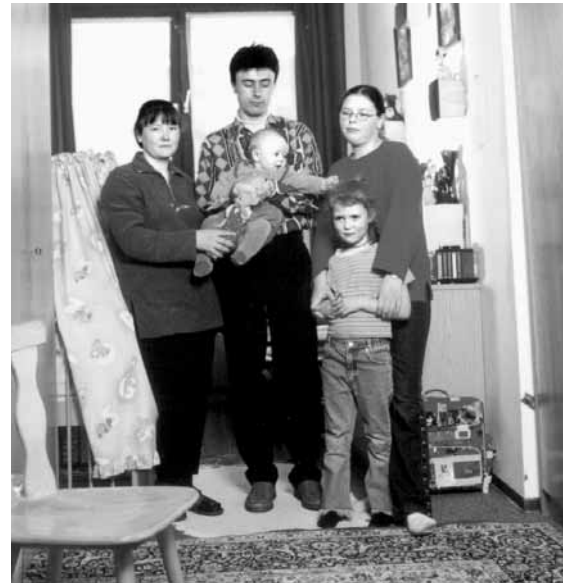
Angst vor Abschiebung müssen viele geduldete ausländische Familien über Jahre hinweg aushalten.

Die Diakonie setzt sich dafür ein, dass geduldete Ausländerinnen und Ausländer spätestens nach fünf Jahren ein Bleiberecht erhalten. Menschen, deren Aufenthalt aus humanitären Gründen auf längere Zeit nicht beendet werden kann und insbesondere in Deutschland aufgewachsene Kinder und Jugendliche sollten eine sichere Aufenthaltsperspektive und damit die Möglichkeit zu einem menschenwürdigen Dasein erhalten. Die Erteilung eines Bleiberechts darf nicht von einer Erwerbstätigkeit oder einer bestehenden Unterhaltssicherung abhängig gemacht wer-