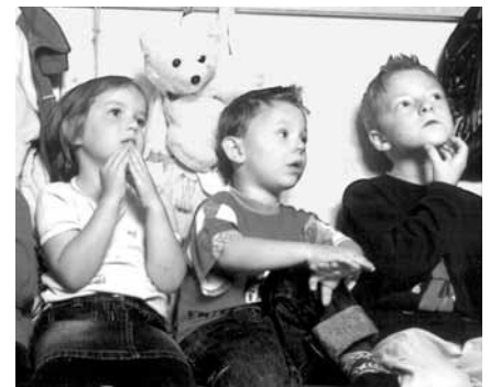
Damit die Kinder nicht auf die lange Bank geschoben werden, sind viele Fragen für integrative Kindertagesstätten in Zusammenhang mit der neuen Gesetzgebung rasch zu klären.

Es gibt viele offene Fragen, die bisher noch in vielem ihre Antworten suchen. Denn die damit verbundene Problematik ist so komplex und vielschichtig, dass erst einmal ein gemeinsames Verständnis geschaffen werden muss, um darauf basierend, zu einer zukunftsfähigen Lösung kommen zu können.